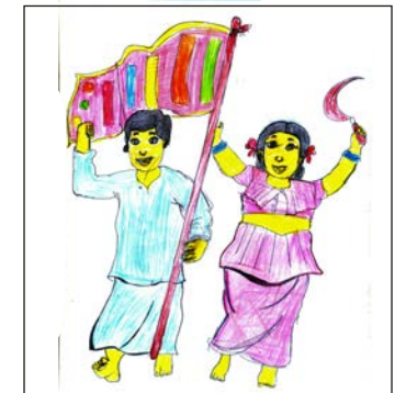
Rithara - 3-J