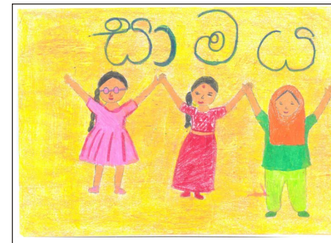
Saduni Maneesha - 4-S