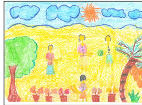
Senushi Mendis - 3-J