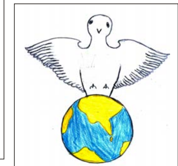
Seshali - 3-J